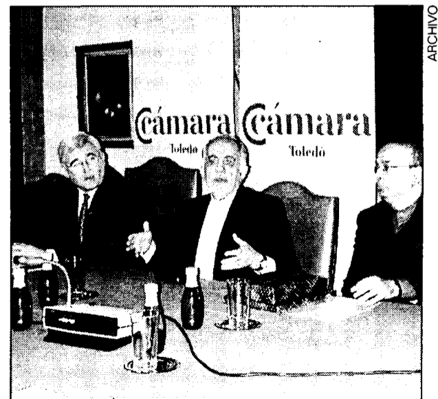
En la imagen, el embajador de Irán en la Cámara de Comercio de Toledo.

Además, y tras la reciente visita del presidente Aznar al país, se han aprobado medidas legislativas para promocionar y proteger la inversión extranjera y el intercambio de tecnología.