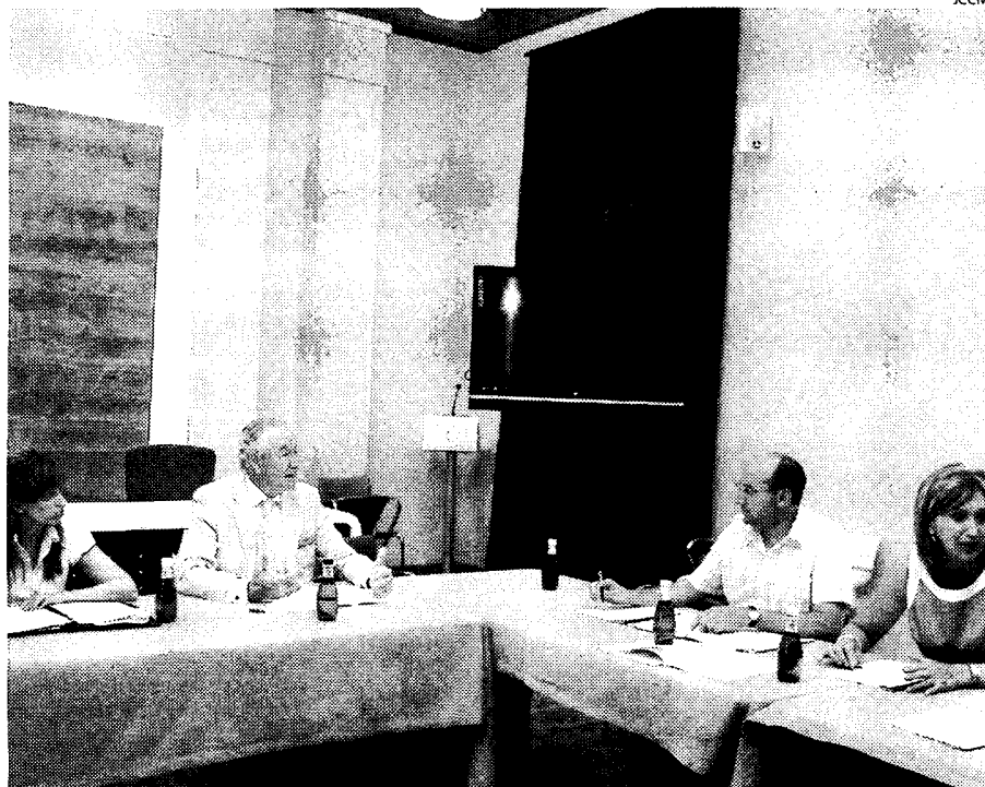
Momento de la reunión con los presidentes de las federaciones de comercio.