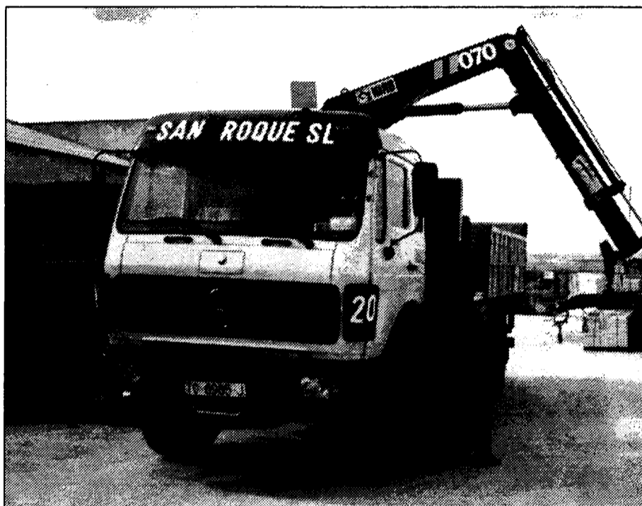
Pavimentos San Roque dispone de su propia flota de camiones para la distribución de sus productos.

obtuvo en el pasado ejercicio un volumen de negocio cercano a los 330 millones de pesetas. "La facturación ha sido