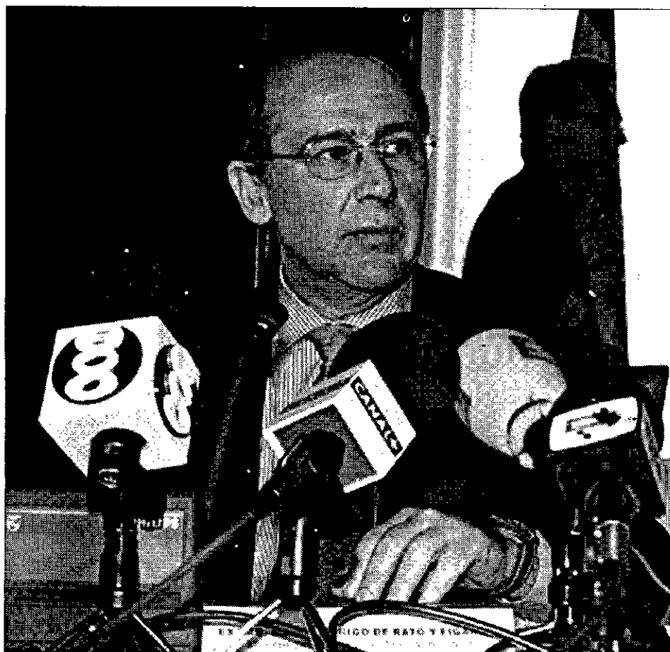
SATISFECHO A Rodrigo Rato, ministro de Economía, el empleo le sigue dando buenas noticias.

Lo que no parece prosperar, a la luz de los números, es el concepto del reparto de trabajo. Entre julio y septiembre de este año se destruyeron 42.000 contratos a tiempo parcial, en tanto que los firmados a tiempo completo crecían en un número cercano a los 200.000.