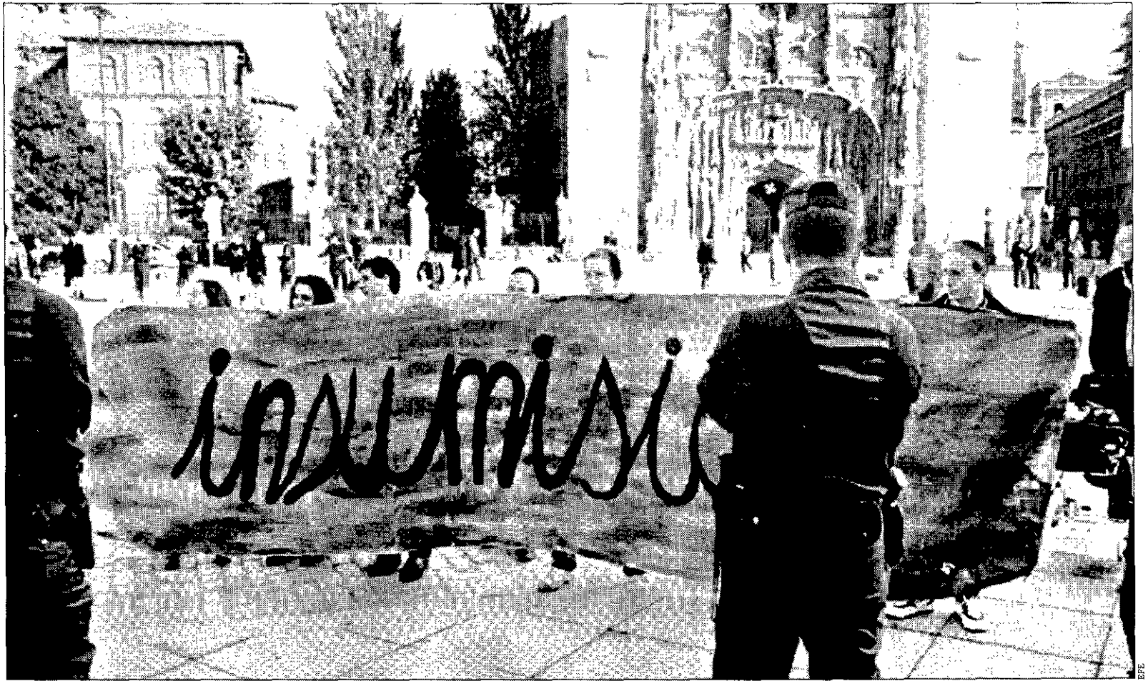
INSUMISIÓN Un grupo de jóvenes del Movimiento de Objeción de Conciencia de Valladolid, protestaron contra el sorteo de excedentes de cupo del miércoles.