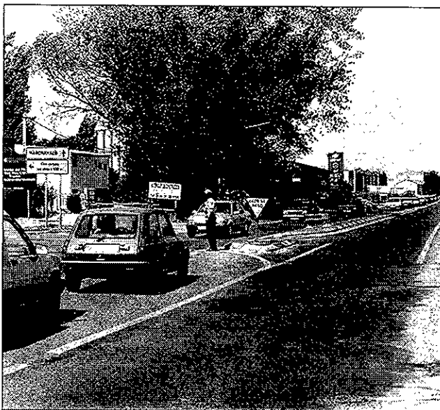
El tráfico comienza a ser denso los fines de semana.

El resto de las carreteras no han tenido, hasta ahora, ningún problema.