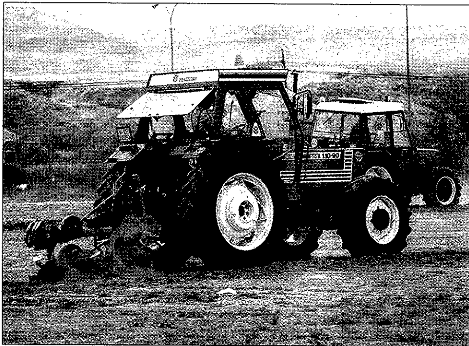
Los agricultores lucieron sus habilidades en la mañana de ayer.

La prueba de Habilidad consiste en realizar un ocho