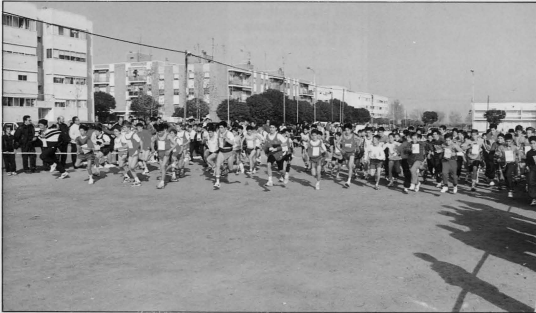
Jóvenes y niños parten ilusionados después del pisetazo de salida.

La tradicional carrera del Día del Chorizo se celebró, un año más, con la participación de unos mil atletas y la asistencia de numeroso público que se concentró en el circuito de la Barriada de las 630, detrás del estadio municipal. En esta 27 edición del Cross popular no participaron algunos clubes atléticos de la provincia, lo que ocasionó cierta decepción y malestar entre los organizadores de la prueba más antigua de Castilla-La Mancha.