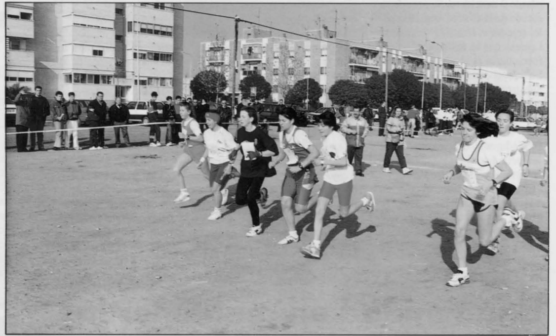
Cada día es mayor la participación de mujeres en esta prueba campo a través.