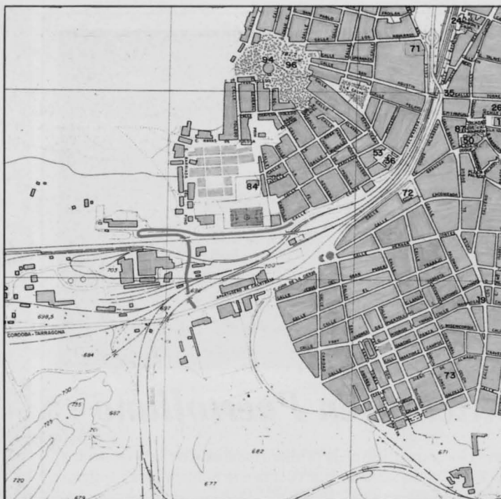
El tramo que aparece marcado en el mapa será asfaltado y acondicionado para un mejor acceso de la barriada a la carretera Nacional 420.

iluminada con farolas de 7 m. de altura. El plazo de ejecución de la obra se ha establecido en cuatro meses a partir de su adjudicación, prevista inicialmente para finales del mes de noviembre. ■