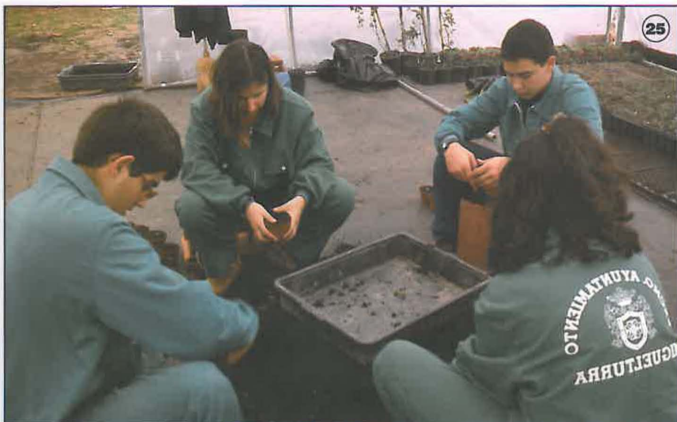
Foto 25: Chicos y Chicas en uno de los cursos de Garantía Social en el Vivero

La atención a nuestros jóvenes nos ha llevado a desarrollar, y durante cinco años, los cursos de Garantía Social, subvencionados por el MEC, y dedicados a aquellos jóvenes que no siguen estudiando o bien están a la espera del primer empleo, formando y gratificando en actividades como jardinería y viveros, mantenimiento de edificios, etc.