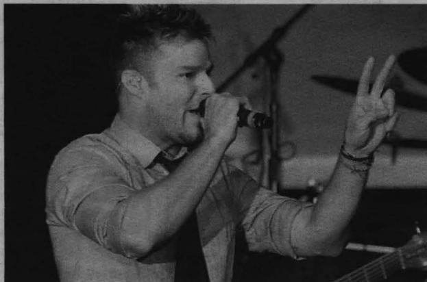
Ricky Martin, puertorriqueño, dio su respaldo a Hillary Clinton.

Esas imágenes no eran suficientes para que el senador por Illinois ganase en Puerto Rico, que ayer elegía a 55 delegados y donde Clinton se impuso con el 60,3% de los votos, aunque con una abstención del 80%, según los primeros sondeos. Además, la senadora por Nueva York, contrarrestó el golpe gracias al apoyo de otro saleroso latino, el cantante puertorriqueño Ricky Martin. Pero eso no servirá