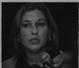
Livni pidió la dimisión de Olmert el pasado jueves.

Livni es ahora ministra de Exteriores de Israel y la principal candidata a suceder al primer ministro,