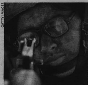
Un marine con un rifle. Estados Unidos acaparó el 45% del gasto mundial en armas.