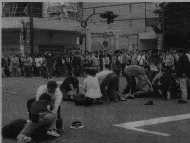
A la izquierda, una de las fotos tomadas por un transeúnte momentos después de la matanza. A la derecha, Kato, en una foto de archivo, sobre el mensaje de móvil colgado en la web a las 5.21.

Ayer, mientras Japón se recuperaba del impacto y decenas de personas se acercaban hasta el lugar de