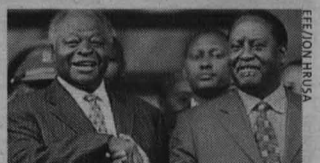
Kibaki y Odinga se reunieron.