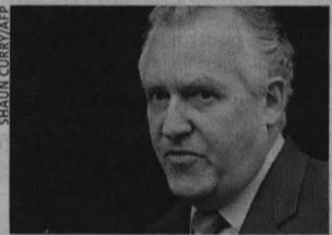
Hain presentó su dimisión.

Venter partía del mapa de la secuencia del M. genitalium que él mismo había descifrado hace años y que se compone de 582.970 pares de unidades básicas de ADN. Su equipo tuvo que dividirlo en 101 pequeños trozos, sin que ninguno de los cortes afectase a un gen. Luego fabricaron químicamente cada una de esas secuencias e hicieron que dos bacterias unieran las partes. METRO