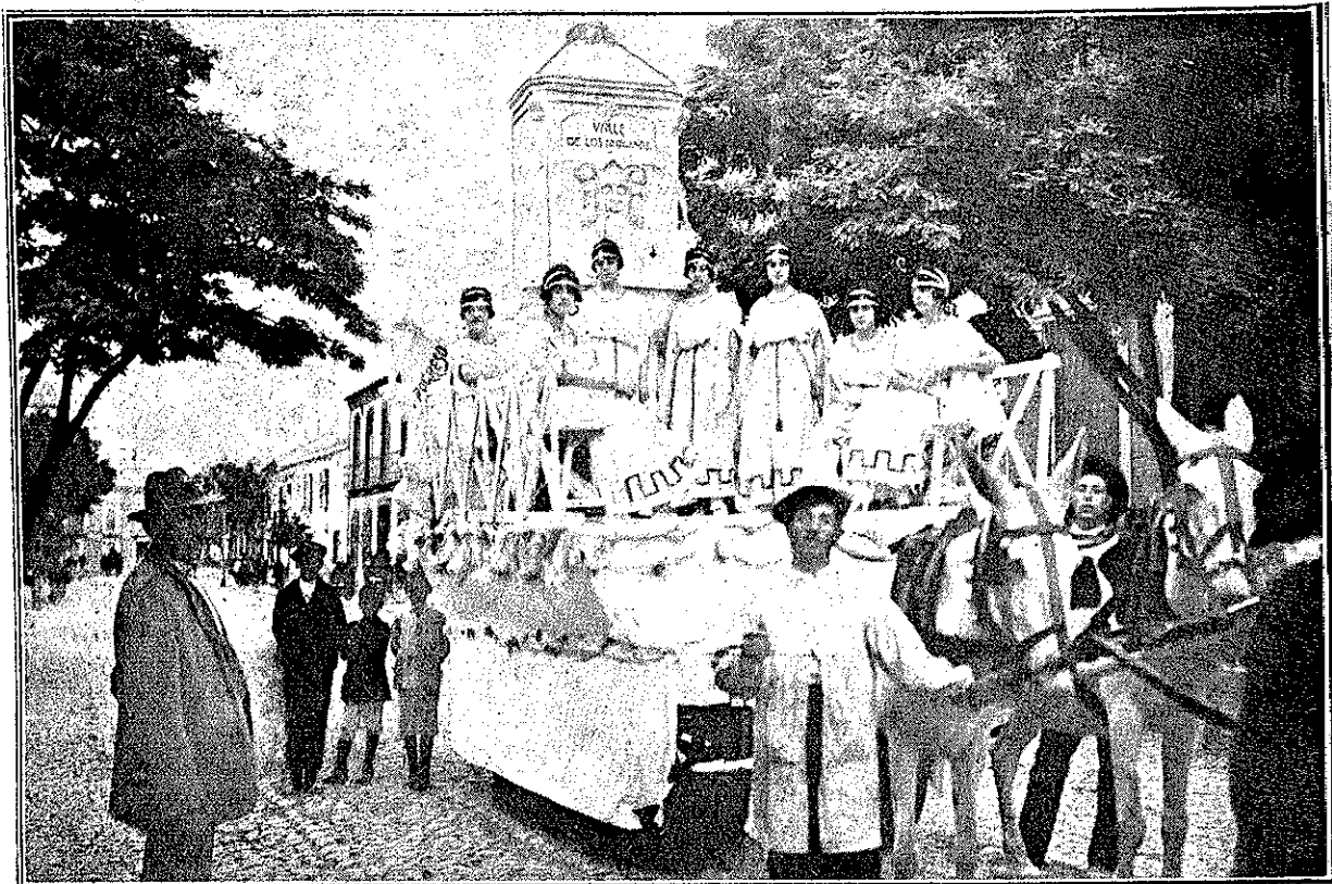
«AGUA QUE HAS DE BEBER» PRESENTADA POR LA SOCIEDAD DE ABALTECIMIENTO DE AGUAS