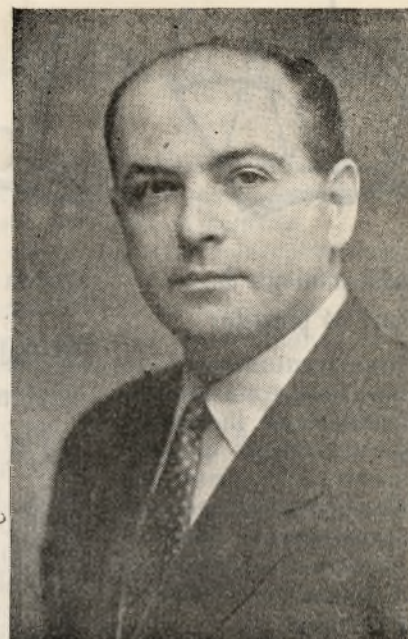
El Delegado Nacional de Sindicatos, camarada José Solís Ruiz.

Al dar cuenta de tan laudatoria comunicación, lo hacemos, para que quede constancia pública de este reconocimiento, que, sabemos, encuentra en el profesorado del Centro la íntima satisfacción del cumplimiento, sin regateos, del deber docente.