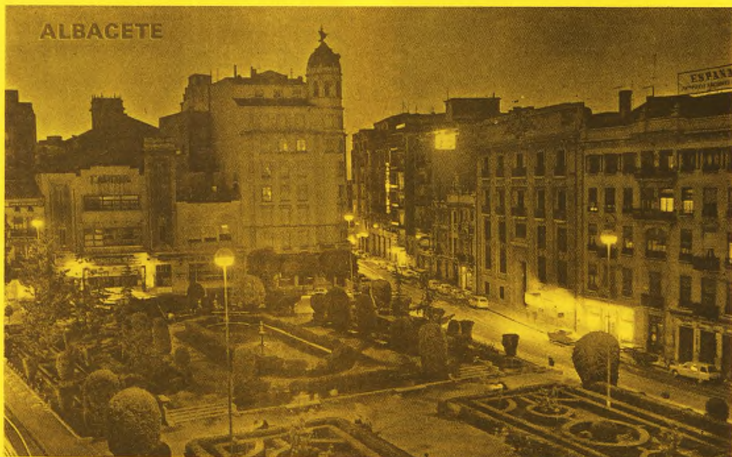
Plaza del Altozano

Los tiempos cambian una barbaridad —según proclaman la canción y los políticos—, y hoy, sin haberse desprendido de su peculiar individualidad ni tipismo, Albacete sorprende al visitante por su porte de ciudad moderna, limpia, luminosa y llana hasta desbordar el tópico, variopinta, geométrica en arquitecturas y cosmopolita de tipos y de gentes. No hay aquí piedras milenarias, ni rincones que rezumen historia, ni ancestros patrioterros; por eso, tal vez, no es ruta de renombre en ninguna guía de turismo. Los escasos palacetes de estilo colonial barroco se han desmantelado en aras del funcionalismo, y solamente el Palacio de la Diputación (donde se guardan obras de Carducho, Gilarte y Benlliure), el Pasaje de Lodares y la Catedral gótica renacentista (antigua iglesia de S. Juan Bautista, donde se puede admirar el retablo churrigueresco del altar mayor y un Santo Cristo que se atribuye a Montañés) son los únicos restos de un pasado reciente.