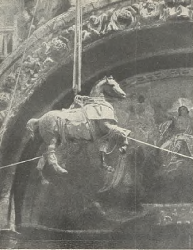
La quadriga de bronce que corona la iglesia de San Marcos, en Venecia, da lugar a este curioso "descendimiento".