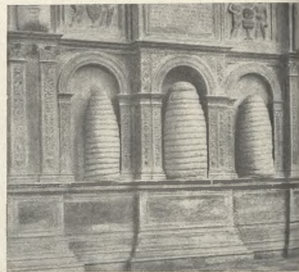
Una «cuaresma» trágica reviste los altares.

Cuando las campanas de las iglesias tocan al arma y un arrebató trágico conmueve la ciudad y las madres se afanan por salvar sus hijos y todo huye de la superficie de la guerra, en la plaza desamparada queda inmóvil, indefensa en su pedestal, «ese» imponderable motivo de arte que puede ser un bronce de Donatello o un bajo-relieve de Jacobo Della Quercia. ¿Cómo salvar de la muerte estas obras llamadas a lo eterno? Entonces, la ciudad imagina defensas, ingenia fábricas, reviste de arena las fachadas monumentales, traslada imágenes y lienzos... Queda la ciudad vacía, desfigurada, vestida en simple, de mujer de campo. ¿Imagináis ahora cómo pudo la ciudad señora de Venecia, lujo del mar lujoso, pasar así, vestida de aldeana, por entre los peligros circundantes de la guerra europea?