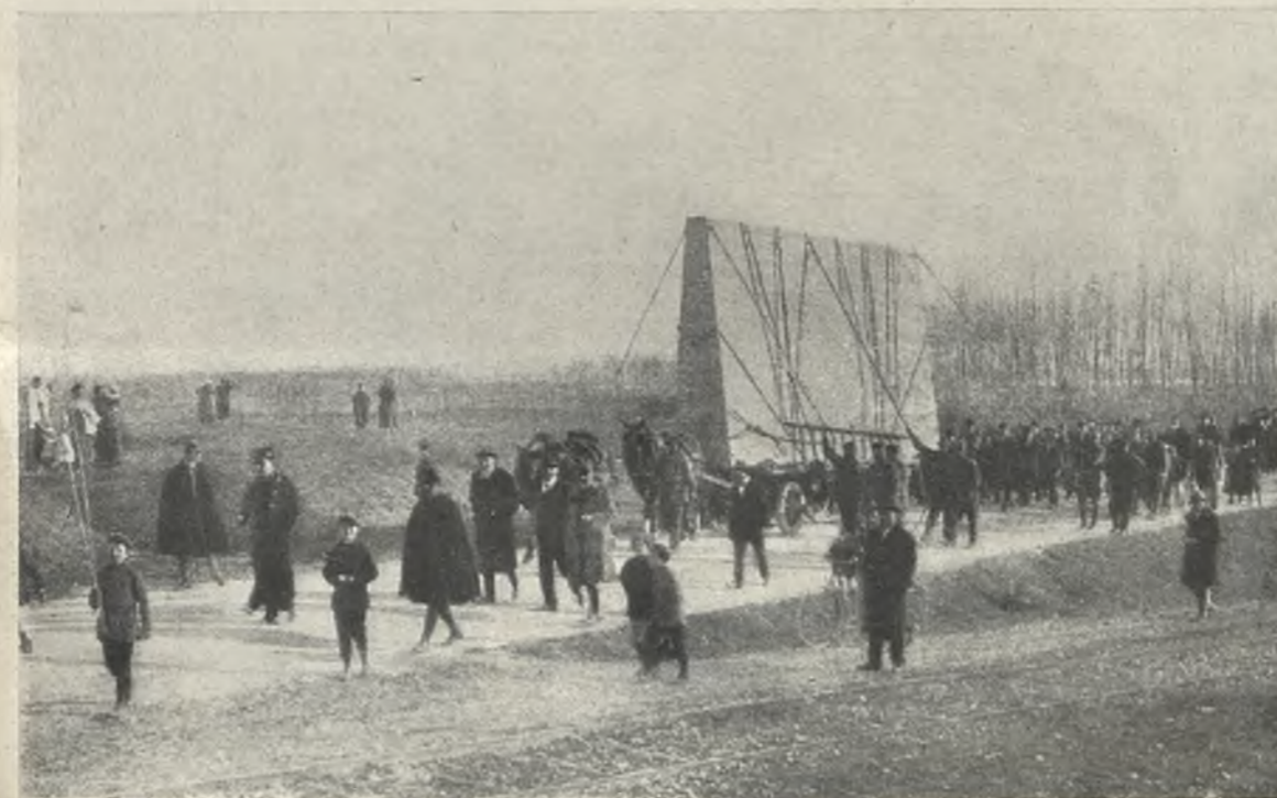
Es un éxodo triste. El pueblo de Venecia acompaña fuera de la ciudad la Asunción del Tiziano para salvarla de las bombas austriacas

¿Quién podía imaginar este angustioso desplazamiento del arte en un país elegido para dar forma—el fondo es nuestro—al mundo? La belleza no tiene ya lugar entre los hombres, ni a la superficie de la tierra—levantada, hirviendo—, conviene una placidez magnífica.