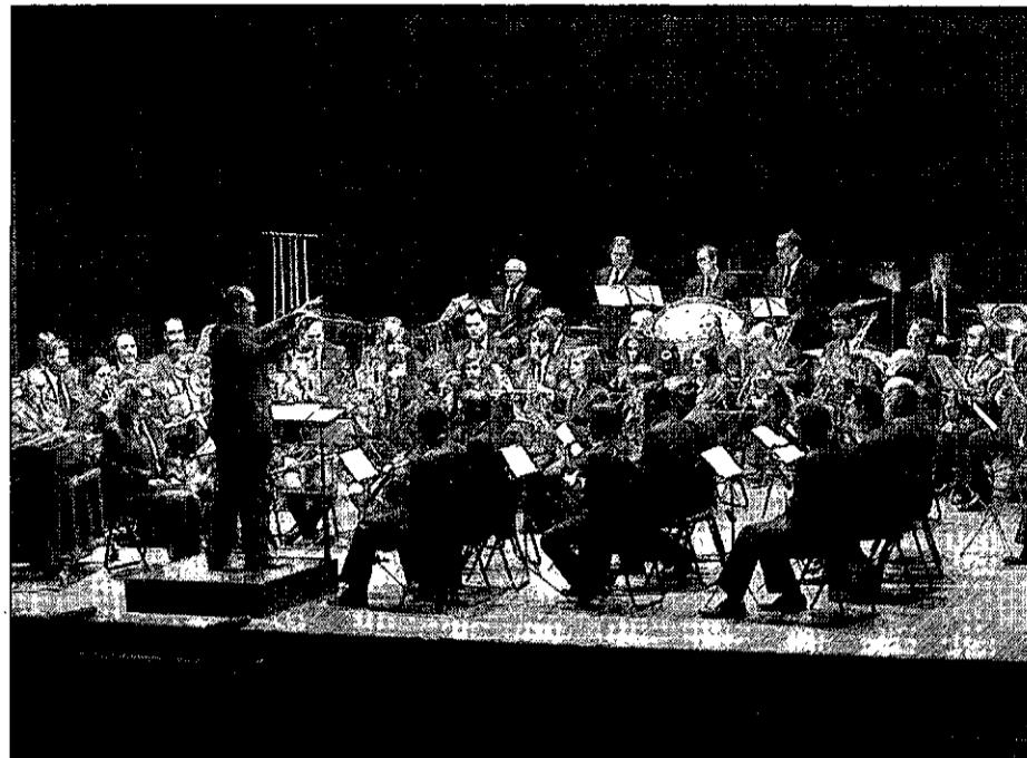
El público responde a la cita con Santa Cecilia. El público del Quijano respondió ayer a la invocación de Santa Cecilia, patrona de la música, y llenó el concierto de la Agrupación Musical de Ciudad Real.