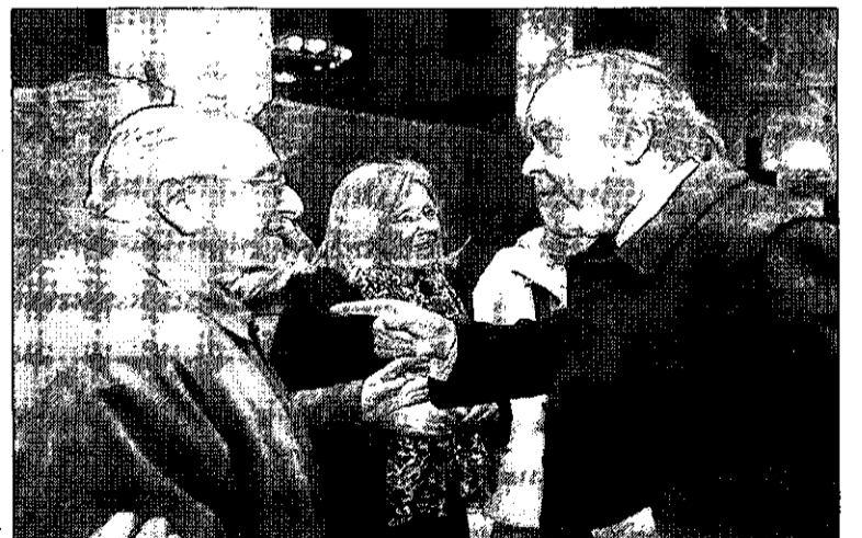
Sena (d) impartió ayer una conferencia en el antiguo Casino.

El experto explica que «una persona con su capacidad de obrar limpia puede determinar que parte de sus bienes se reserven para cuando pierda su mente».