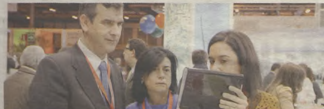
El alcalde y la concejala de Turismo, en FITUR.

culos de promoción de la ciudad y los visitantes pudieron disfrutar de las representaciones que Gentes de Guadalajara realizó del Tenorio Mendocino y degustar los típicos bizcochos borrachos.