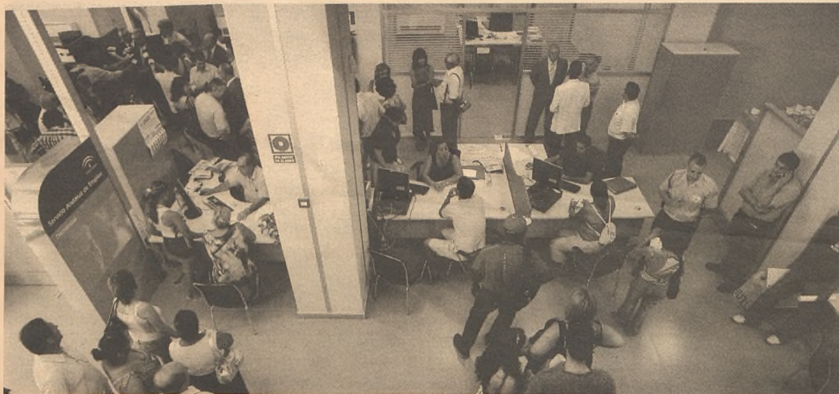
El mes de septiembre no fue un mes bueno para las listas del paro de la provincia de Guadalajara / Economía de Guadalajara