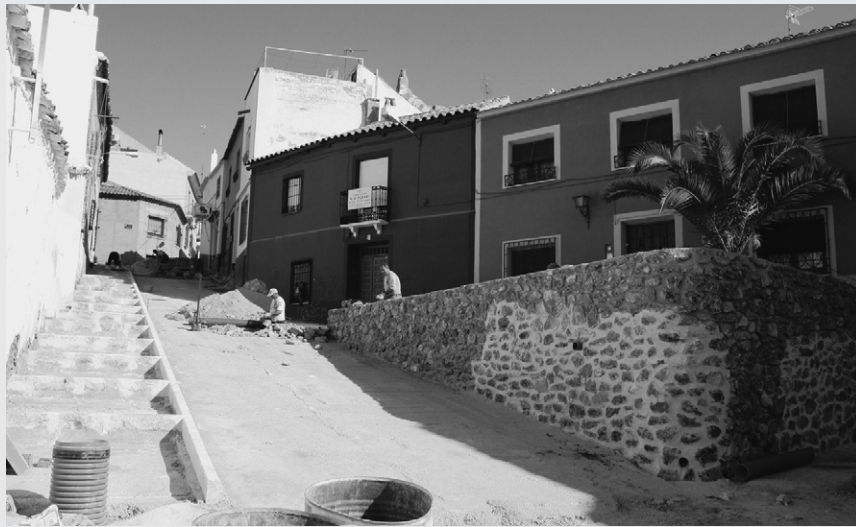
▲ Escalerillas y muro ya reparado.

U n plan de empleo de la Diputación está permitiendo sustituir las viejas escaleras de la calle Cárcel Vieja y reconstruir el muro de la parte baja. Las escalerillas han sido demolidas debido a su mal estado e incomodidad. La remodelación consiste en construir una