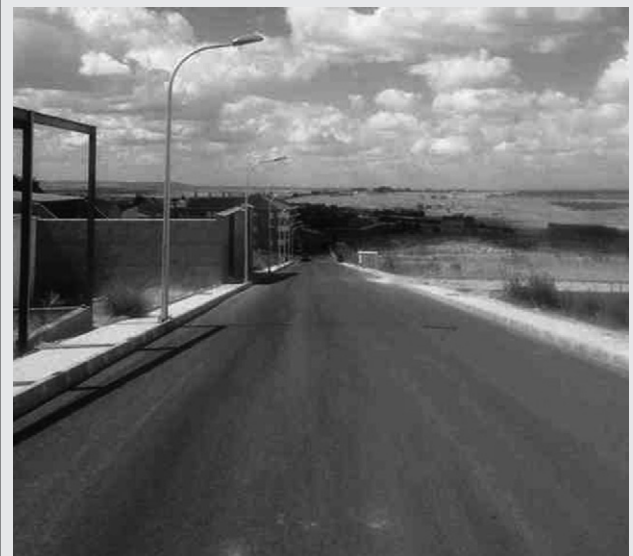
▲ Calle Norte.

iluminación con báculos de luz led. Un importante desahogo al tráfico que entra y sale por la Avenida de la Romería. La obra se ha llevado a cabo a través de un plan de empleo municipal.*