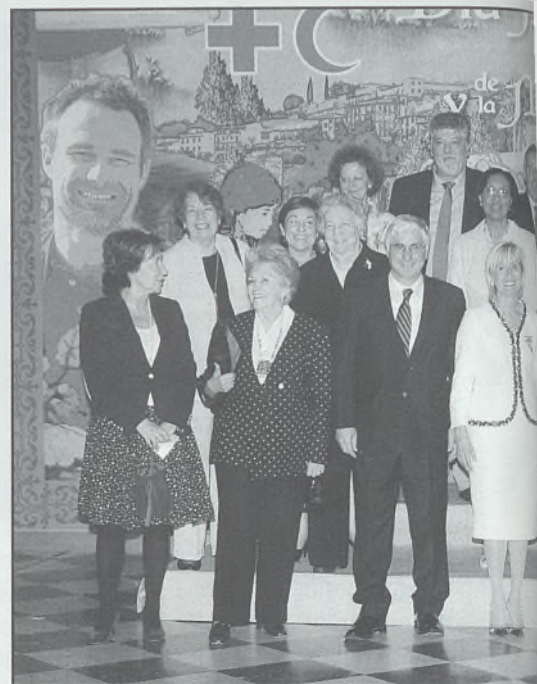
La Infanta Cristina con los premiados por Cruz Roja este año, el presidente Barreda y el alcalde de Toledo, Emiliano García Page y los responsables nacional y regional de Cruz Roja.

del día, todos los días del año, del 10% de los mayores de 65 años en la provincia de Toledo: 13.000 personas que viven solas. Son las que disponen en casa de una terminal que les mantiene permanentemente comunicados con una central (la de Castilla la Mancha está en Guadalajara). Sólo con pulsar una especie de medallón que llevan siempre puesto, este servicio de teleasistencia se activa y a través de un altavoz pueden hablarles y recibir su petición: si se sienten enfermos o en peligro, si se han caído... Los voluntarios y los 40 pro-