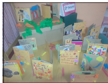
Exposición de libros-acordeón