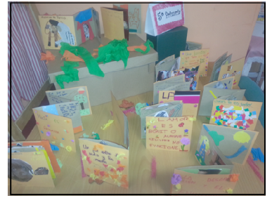
Exposición de libros-acordeón