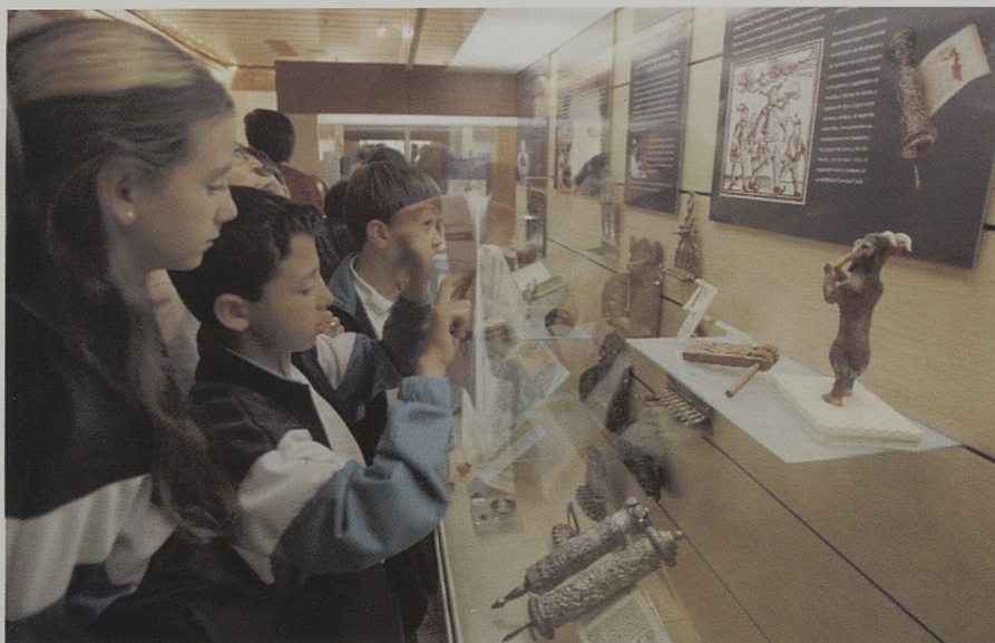
Grupo de niños participantes en la Gymkhana cultural buscan en las vitrinas la respuesta a los enigmas planteados.

Como cierre al capítulo de programación infantil, se ha de citar la actividad diseñada para el 18 de mayo «Día Internacional del Museo», que este año 2005 tuvo por lema «El Museo, puente entre culturas». En esta fecha tan especial, el Museo Sefardí diseñó, en colaboración con el Museo de Santa Cruz y el Museo de los Concilios de Toledo y de la Cultura Visi-