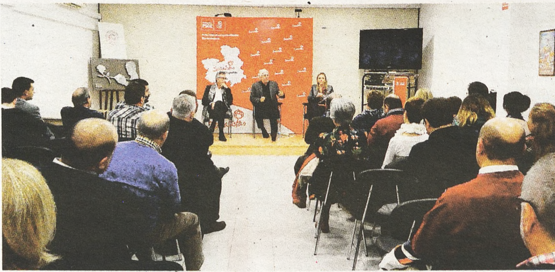
Acto público informativo en la Casa del Pueblo

► Asamblea informativa sobre los Presupuestos Generales del Estado