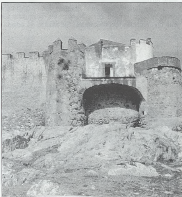
Valencia del Ventoso, detalle

Sus orígenes se remontan a la Prehistoria, los pri-meros testimonios que nos ha legado el tiempo son los men-hires de las riberas del Ardila. Los restos arqueológicos des-cubiertos en sus alrededores hacen suponer que ya estaban habitados en los albores de la Historia. Existen restos roma-nos que se corresponden con una piedra rectangular, que contenía la inscripción: " Terminus Augustalis Finis Emeriti-