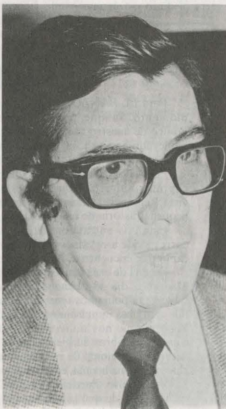
ALCALDES DE ALBACETE Y CIUDAD-REAL: LA UNIÓN ES NECESARIA Y POSIBLE

Su Región. Esta Región. ¿Cuál Región? A pesar de todo, de la confusión siempre