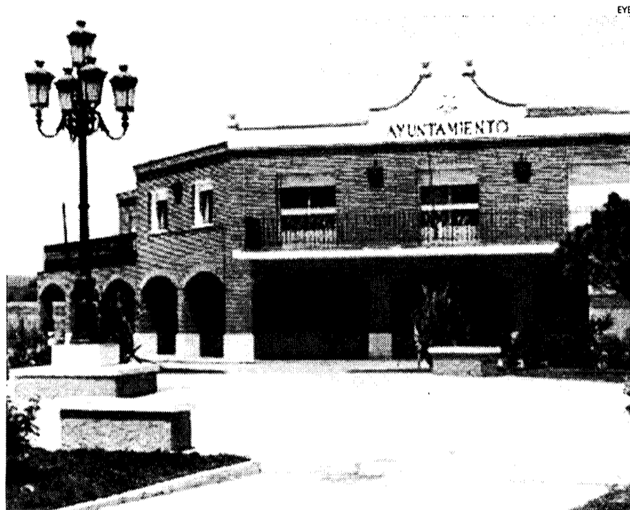
Azuqueca recibe una inyección inversora para parados de un millón de euros.

El Gobierno regional apoya a la localidad con un millón de euros para que los parados accedan antes al mercado laboral