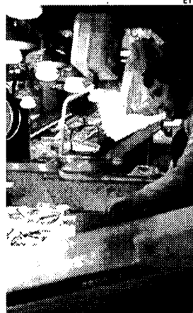
El número de autónomos sigue bajando.

Por provincias, la que ha registrado un descenso más acusado de autónomos ha sido Albacete con 223 autónomos menos, un -0,73% en términos porcentuales. Le sigue Ciudad Real.