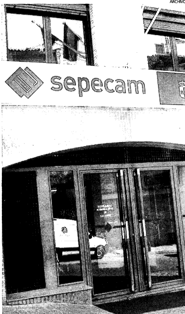
Las oficinas del Sepecam registraron 165.797 parados en julio.

Y eso que sólo en Castilla-La Mancha durante los seis primeros meses del año el gasto acumulado en prestaciones (contributivas, subsidio de desempleo, Renta Activa de Inserción y subsidio para eventuales agrarios) ha aumentado un 93,4% en relación al mismo período del año anterior, hasta superar los