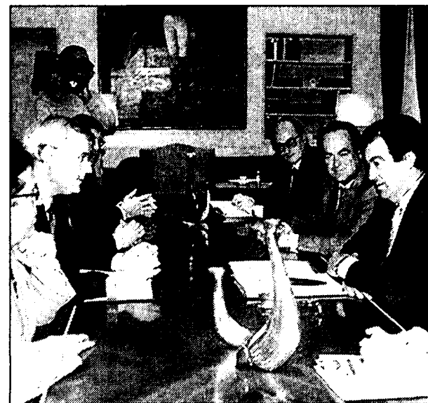
El ministro Alvarez Cascos visitó Alcazar de San Juan.

yecto se podrían crear 150 puestos de trabajo directos y fomentar la aparición de empresas auxiliares que darían empleo a otras 150 personas. Los trabajadores de Renfe podrán optar a integrarse en la nueva empresa, en un situación similar a la excedencia.