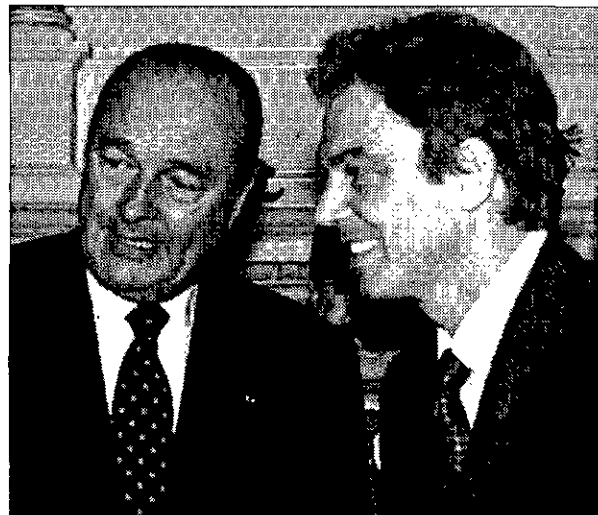
CUMBRE ANGLOFRANCESA Jacques Chirac, ayer con Tony Blair.

Los seis días de huelga han supuesto un 'sobrecoste' de 4.800 millones de pesetas para el sector internacional del transporte español por carretera, derivados principalmente de los costes de carburante y viajes no realizados, según fuentes del sector.