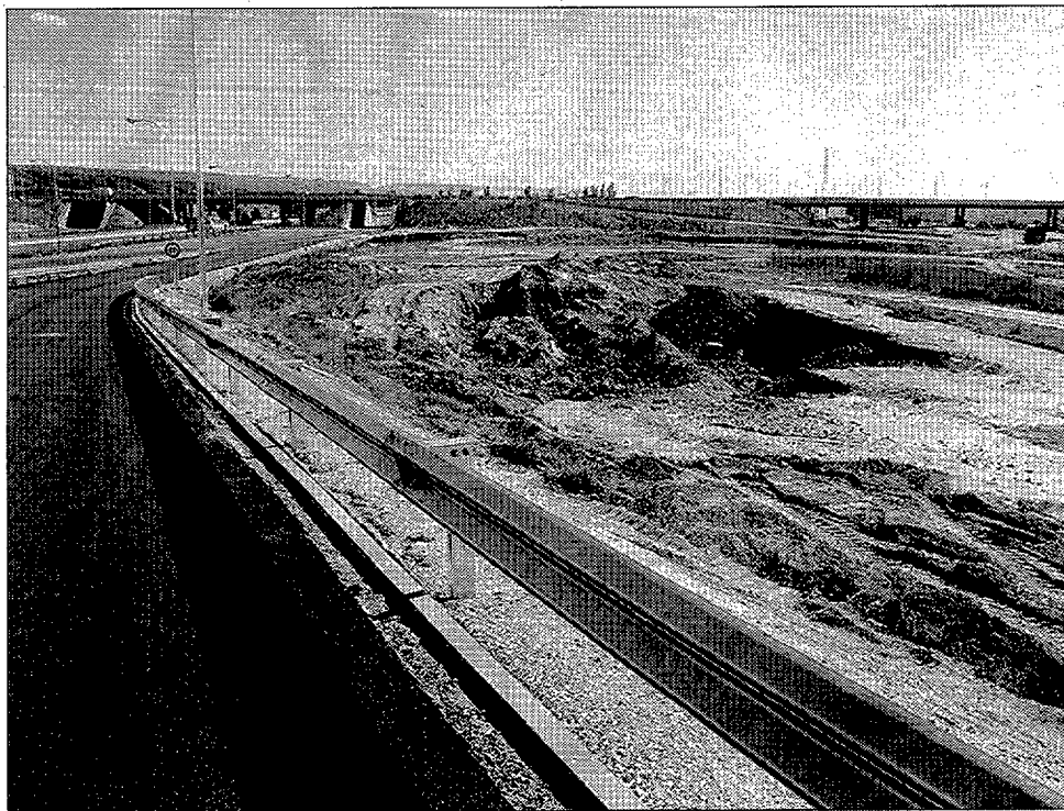
La variante de Cabanillas incluye nuevas infraestructuras de pasos elevados y parte de la N-II.

Se ha acortado la longitud del tramo en tres kilómetros, dejando las 93 curvas existentes hasta ahora en 20. Además se ha puesto especial cuidado entre los kilómetros 224 y 227 en no provocar ningún impacto ambiental, por lo que en este subtramo las obras se han limitado a mejorar el firme.