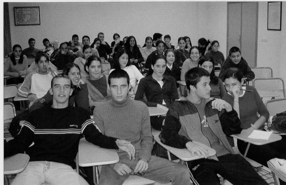
Se ofrecerán tres charlas en cada centro educativo