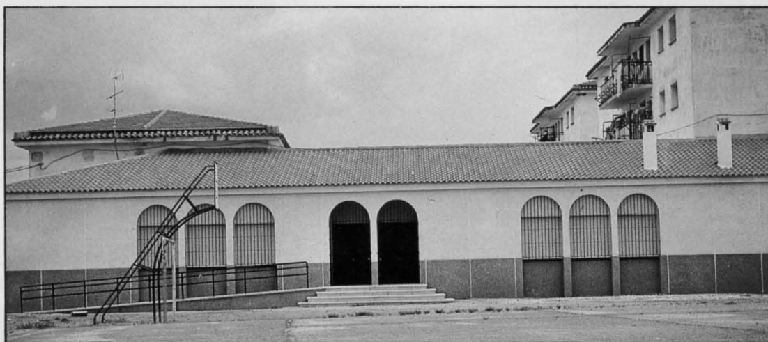
Vista general del nuevo Centro Social de la barriada Libertad.

En el acto de inauguración de este último, el Alcalde hizo público su deseo de que la barriada de El Pino cuente próximamente