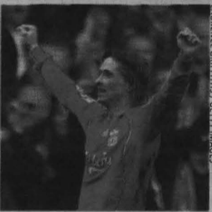
Fernando Torres ha marcado cinco tantos en la Champions.

a la ingesta de fármacos. El ex futbolista internacional ha sufrido varias depresiones y actualmente milita en TSK Roces, de la 1ª Regional asturiana.