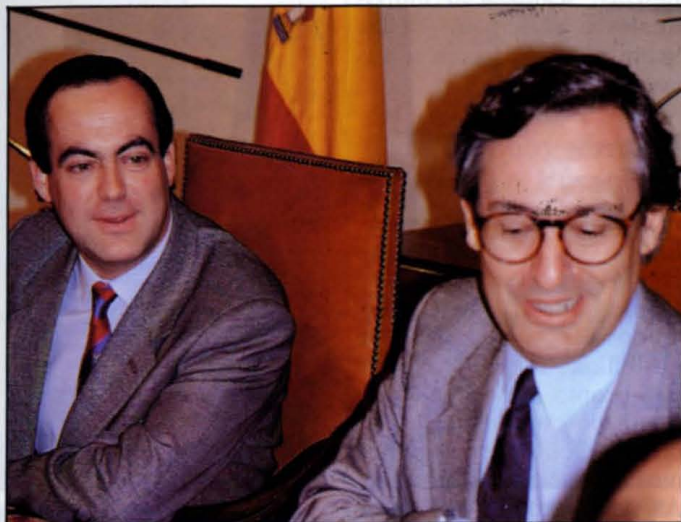
Bono y Solana, dos hombres y un destino que no pasa por el tercer canal autonómico.