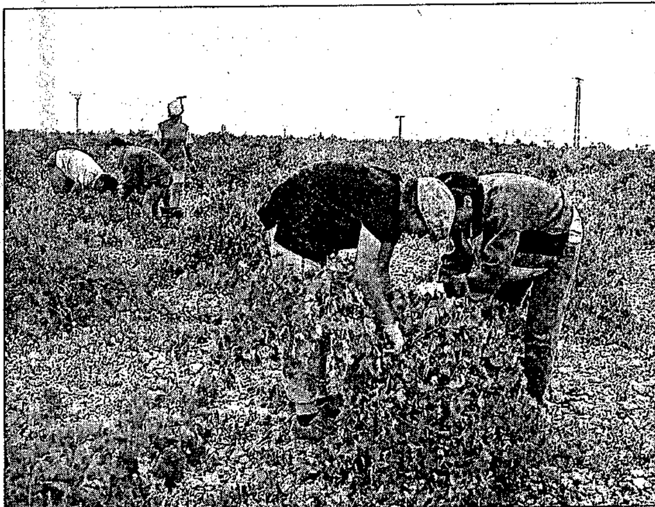
Asaja estima en 10.000 millones las pérdidas en el campo por el temporal de verano

Asimismo, ha solicitado para los titulares de explotaciones afectadas ayudas directas, créditos sin interés, rebaja de los módulos de IRPF, exención del pago de las cuotas de la Seguridad Social Agraria y del Impuesto sobre Bienes Inmuebles, de naturaleza rústica y urbana, además de un incremento en un 25 por ciento de las ayudas por indemnizaciones compensatorias de montaña y zonas deprimidas, entre otras.