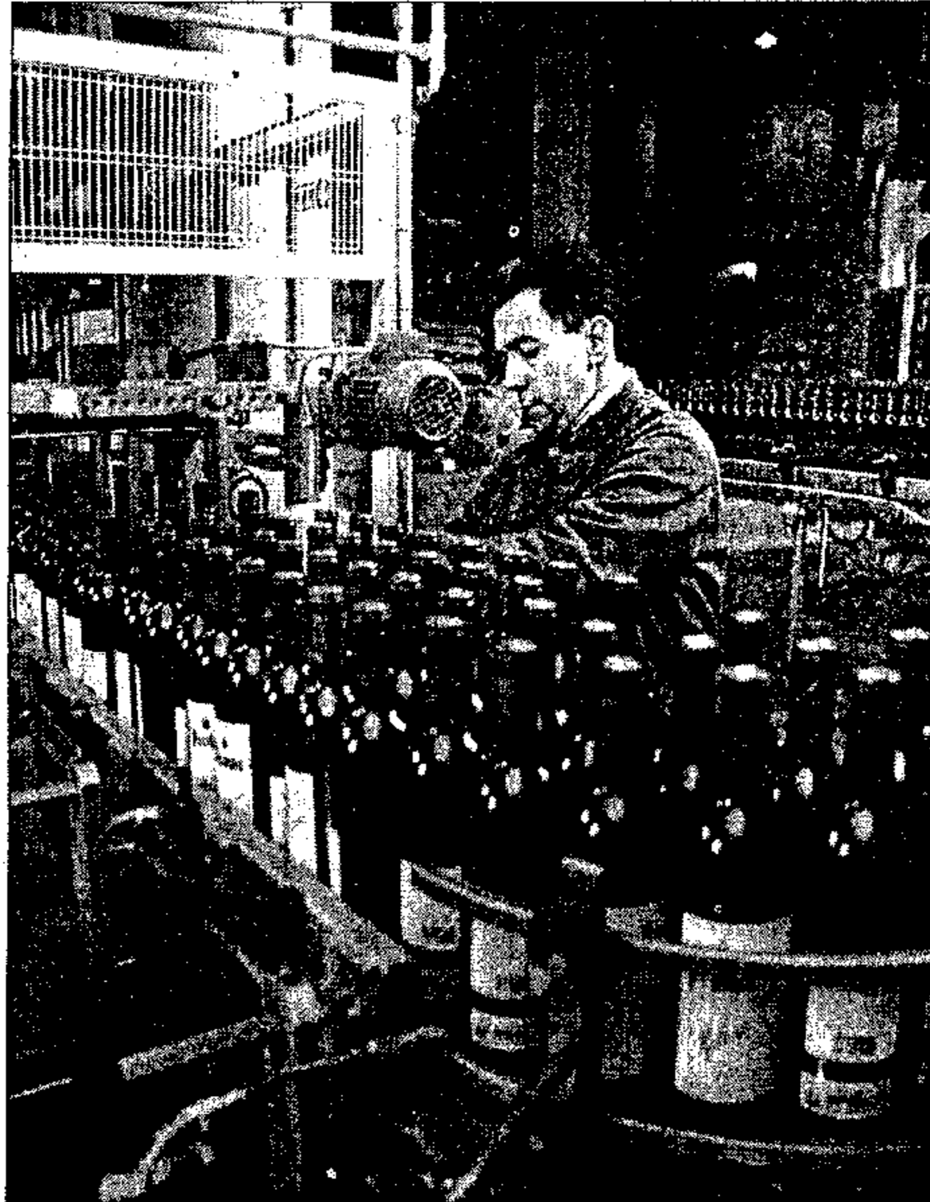
La Feria del Vino de Mondéjar difunde los mejores caldos de la zona

Dentro de los actos programados para la feria de este año destaca el III Concurso de Pisa de Uva de Mondéjar, el de cata de vino así como una demostración de corte al jamón. Destaca tam-