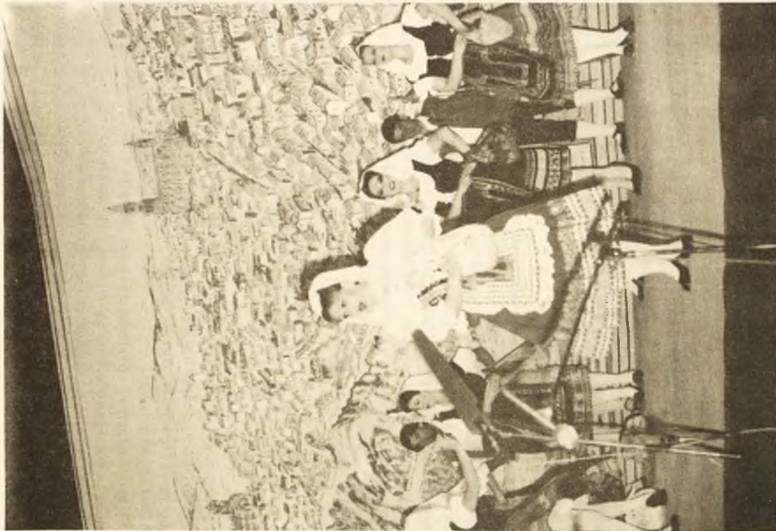
Arriba: Zarzuela, la compañía Lirica Española puso en escena el Huésped del Sevillano.