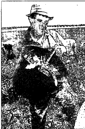
Un agricultor trabajando.