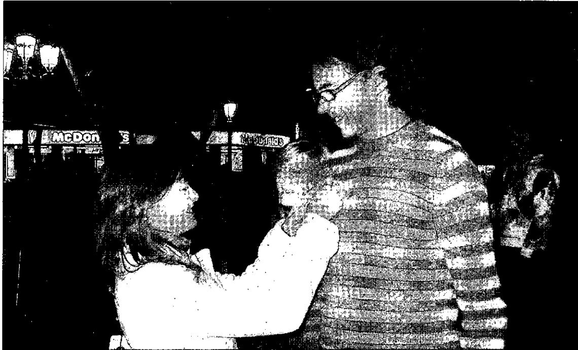
Miembros de ACCEM ponen lazos rojos a los ciudadanos.

ACCEM informa sobre qué es el VIH, cómo se transmite y cómo no se transmite, así como las formas de prevenirlo, con la utilización del preservativo y evitando el uso de jeringuillas, agujas y otros