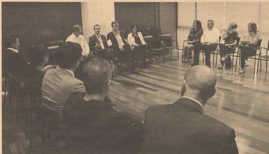
El alcalde mantuvo un encuentro con los emprendedores del centro.