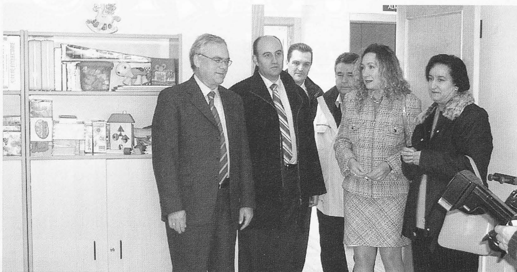
El consejero de Bienestar Social, Tomás Mañas, en la inauguración.

El centro infantil para niños con algún retraso se levanta en la Avenida de la Libertad, cerca del IES "Modesto Navarro". En resumen, las modernas instalaciones que se han construido cuentan con tres aulas de fisioterapia, dos de logopedia y una de estimulación, además de una sala de hidroterapia con piscina adaptada.