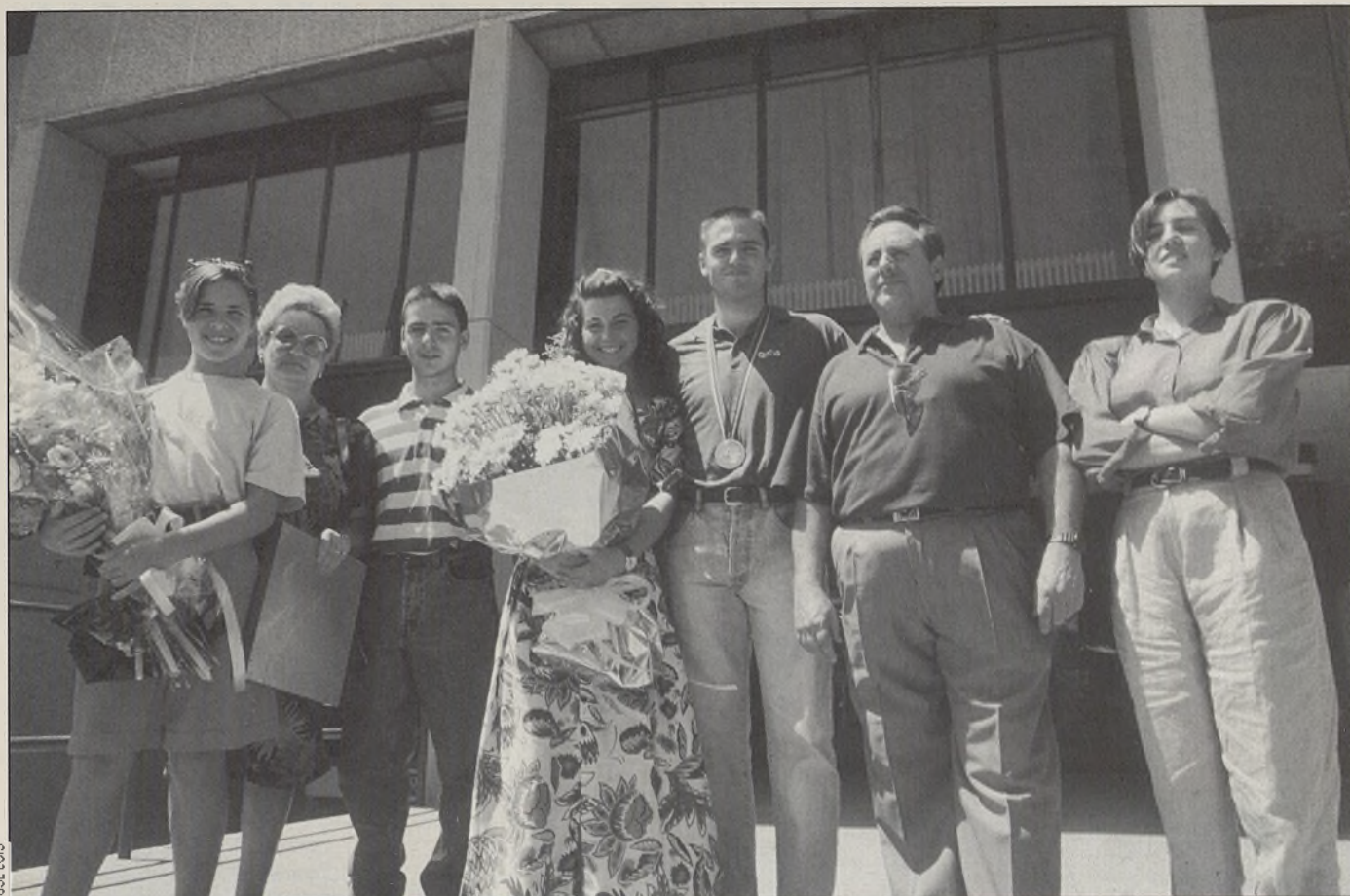
El guardameta olímpico acudió al homenaje que le ofreció el Ayuntamiento acompañado de su familia.