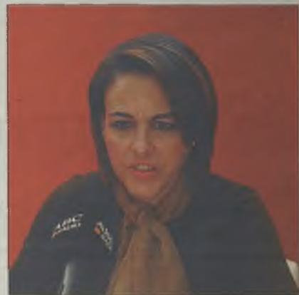
La socialista, Magdalena Valerio

zadas por la portavoz acusándole de incumplir su programa electoral, el regidor guadalajareño señaló que "ha sido ella la que ha incumplido su programa", compatibilizando su escaño en el Congreso de los Diputados con la portavocía en el Grupo Municipal Socialista.