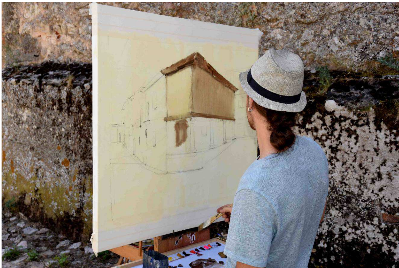
Las arquitecturas de Atienza, fuente de inspiración de artistas