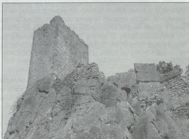
Muros del recinto I

Hoy se accede al interior de la torre por un hueco abierto en el lado Oeste. Pero se trata de una ruptura reciente, como puede advertirse por su posición, y la falta de regularidad de sus laterales. La puerta original se sitúa