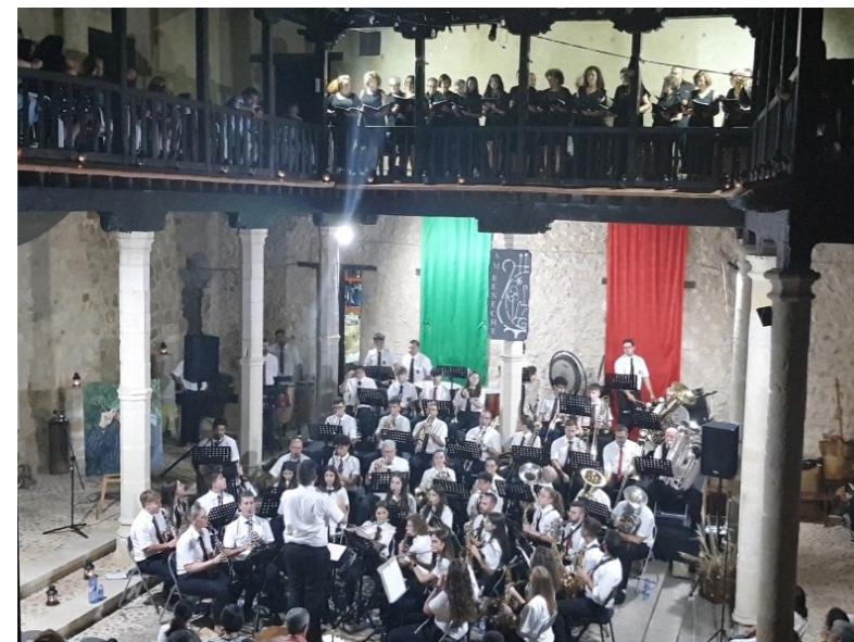
Gran concierto el de este verano

3ª Estrofa. Las viejas piedras del Castillo, Vicaría y signos señoriales, están posados en el recuerdo de días grandes. Este recuerdo redime y alienta las horas dolorosas de nuestro pueblo. Cruceros, Capas, Símbolos de la Orden militar de Santiago, Monjes y soldados. Estampa esplendorosa de un ayer relativamente reciente.