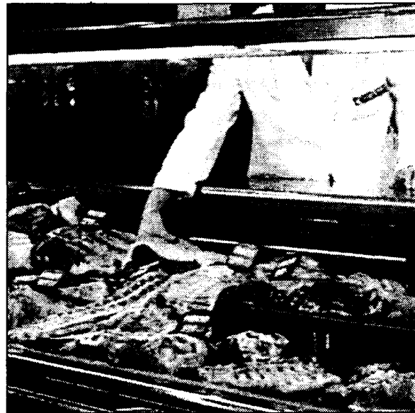
La región cuenta con 9.000 industrias de comidas preparadas.

empresarios de elaborar alimentos seguros hace necesario establecer controles de la propia industria durante todo el proceso de la cadena alimentaria: producción, elaboración, almacenamiento, distribución y venta, para garantizar así alimentos listos para su consumo.